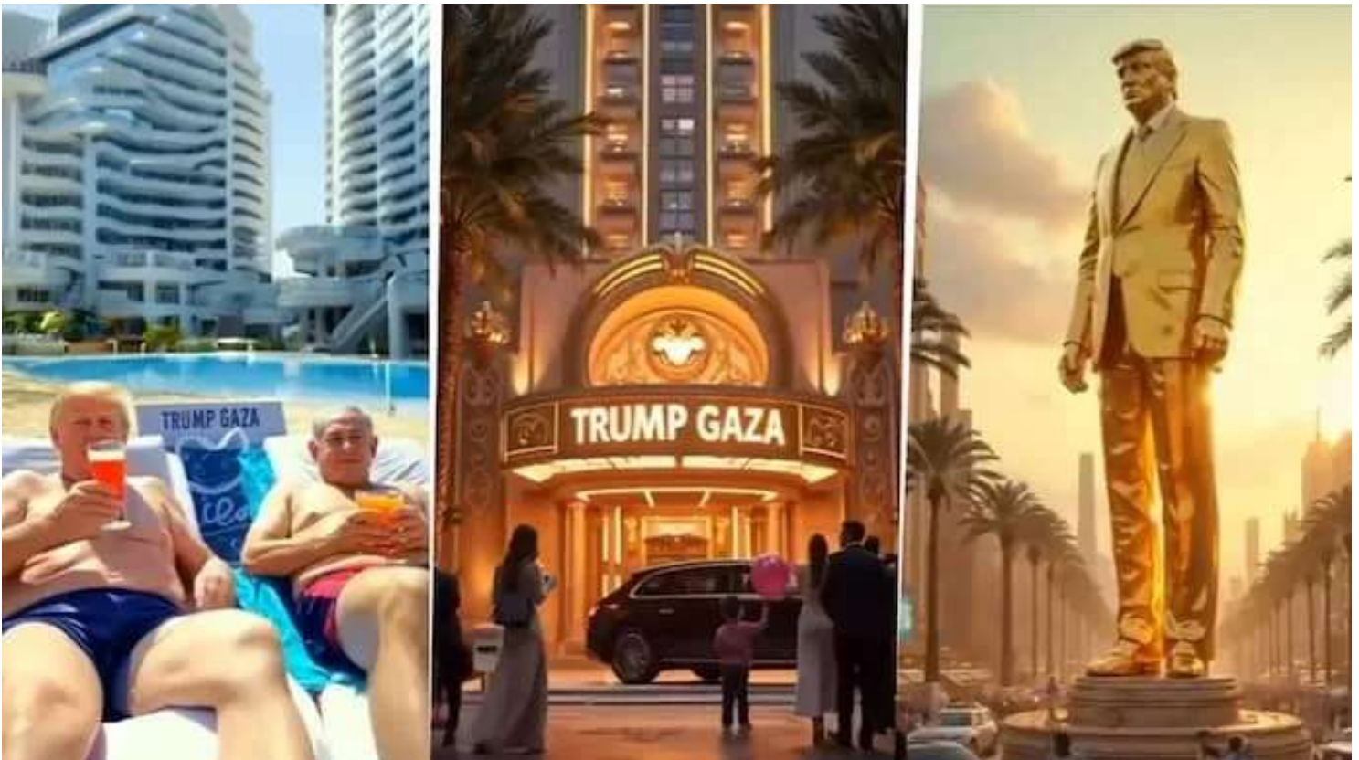
La « Riviera à Gaza, » vidéo générée par intelligence artificielle, partagée par @realDonaldTrump sur le média social Truth Social en février 2025 (disponible sur https://www.youtube.com/watch?v=PsIOp883rfI )