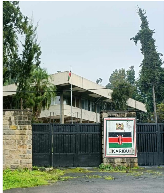
« Karibu », bienvenue, en Swahili.

« Ce qui compte, c'est que vous ayez un intérêt pour le sujet du cours et que vous soyez motivé-e à en apprendre davantage » (Barthe, 2020).